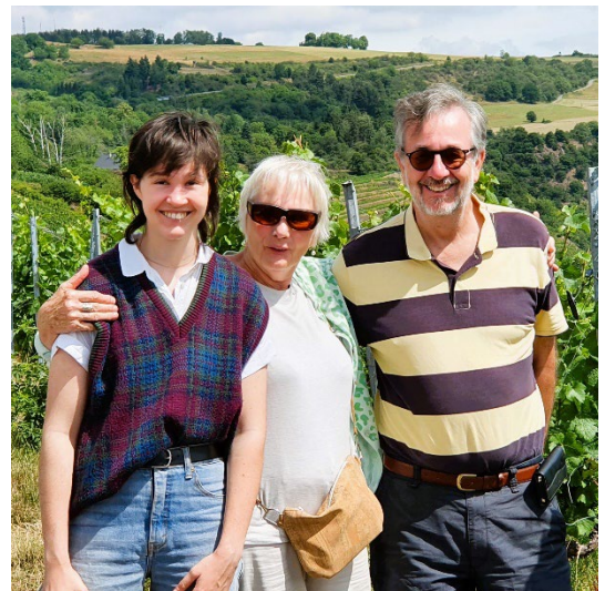
In Halle (Saale)