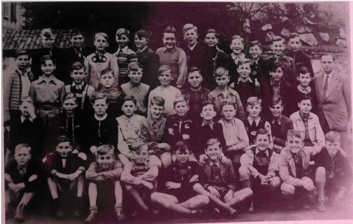
Bild der Klasse 7 K Schillerschule Darmstadt 1953

Über diese Kriegskinder gibt es keine soziologischen Untersuchungen. Nach dem 2. Weltkrieg waren andere Themen existenzieller. Seit etwa Mitte der 1990er Jahre gibt es zahlreiche Veröffentlichungen, die ‚Kriegskinder‘ im Titel tragen. Es sind meist biografische Inhalte mit psychologischen Beurteilungen aus heutigem Erkenntnisstand.